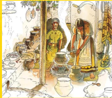
Haciendo cerveza en el Aragón de Edad del hierro. Proyecto "Cabezo de la Cruz", Zaragoza

La cerveza fue el primer alimento que inició la ruta de las cocinas a la producción a gran escala. Otros se le han ido uniendo en este camino del fogón a la estantería del supermercado